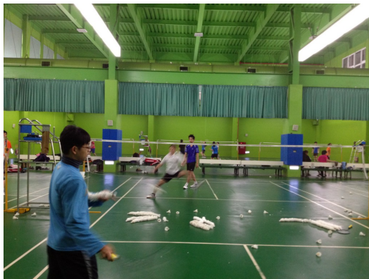
球管裡無止盡的多球練習。

這段苦不堪言的訓練生活裡，經常在體力透支後浮出一句話。現在所做的一切為的是什麼？儘管目標相當的明確，也已經選擇了這麼做，卻仍然有著想要結束這種生活的意識藏在我的心中，牙一咬，整裝完後就是再次練習。