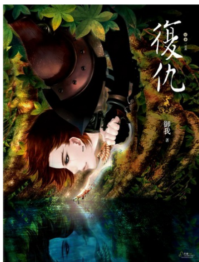
公華二部曲《復仇》。

御我將主角設定在「靈」的種族，透過另一個種族來看待「人類」。人族在書中設定為統治階級，有權者對於力量的渴望、物慾，以犧牲他人來達到自己，甚至是國家的目的。為了這些冠冕堂皇的藉口，他們渴望公華破壞性的力量，不惜以虛假的親近換取信任，進而利用。很奇妙的，這樣的描寫一點都不令人感到衝突，雖然看起來諷刺，但在當代社會，許多社會大眾確實是政治、商業利益下的犧牲品。二部曲《復仇》中，公華已非當初什麼都不懂的守護靈。經過不斷地學習成長，他開始有了人類的情感與思維，懂得「獲得」與「失去」。因為失去的痛，他走上復仇的路。