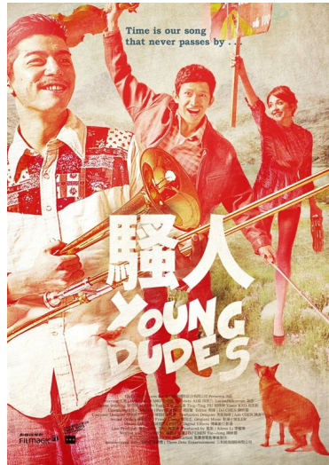
《騷人》用愛與和平的革命作號召，描述了一段逐夢尋我的故事。（圖片來源／騷人官網）

這部非主流電影裡的革命並非槍林彈雨，而是傳遞一種給現代青年的溫暖慰藉，無論你已疲於在現實裡打滾，或者正懷抱熱情向前瞻望，跟著主角吶喊和思索，就會發現瑰麗的色調堆疊起畫面、手持鏡頭的搖晃營造出近在身邊的感受、配合上搖滾樂的節奏，那樣看似荒謬的革命其實就在你我身邊。它像是一則寓言，提醒人們終究得回歸自我，探究最核心的議題——人為何而追求，才能善用環境，用無與倫比的勇氣向世界發聲。最後對眾人，也對自己說出：「能搞革命，我很快樂！」