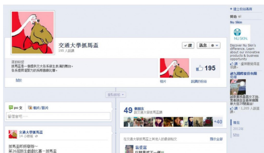
於十月六日所成立的交通大學抓馬盃粉絲專頁。

希望能讓抓馬盃這個在交大二十多年的傳統延續下去，並且為戲劇社招收更多熱愛表演的新血，各系也能透過這個動員全系的活動凝聚情感，培養系上的向心力，達到戲劇社與各系雙贏的局面。