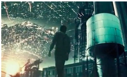
由下層社會仰望，看見的是燈火燦然的上層社會。

《顛倒世界》中一對不同階級的戀人，突顯上下階層的社會衝突：下層社會是個沒有燈火、能源匱乏的世界，然而人民卻日日在鐵皮工廠內提煉石油，如標準化的機械般工作不停歇，以供上層社會使用；而上層社會則是燈火通明、充滿展望與科技感的先進都市，他們提供給下層社會的，除了無窮無盡的工作、限制與規範外，便只有如繁星熠熠般，無時無刻閃耀的燈光，以供終年闌暗的下層世界在夜晚仰望。