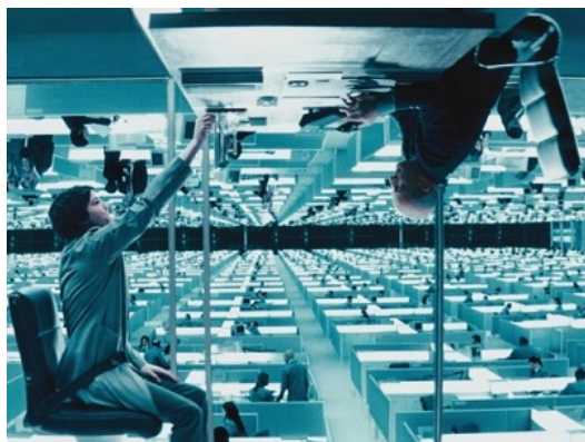
在過渡區的辦公室中，一切還是由上層主宰。

其吃力地配合上層的視角與「正確方向」。過渡區成功地以「上與下」的概念和畫面塑造出階級的尊卑。