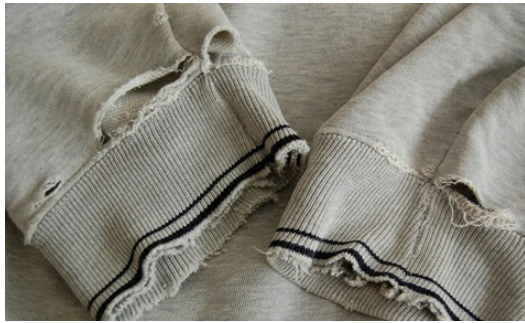
漸漸地，他的袖口不再溼了，但已破的袖口日子久了也越穿越大洞。

男孩也領著一些同學去和他相處、交談。他喜歡聽好笑的話，男孩就說給他聽，久而久之，一種彼此的信任建立了，不再只是簡單的點頭搖頭，更多的詞彙從他口中說出，都令男孩和同學覺得驚訝與振奮，「嗯！」「好啊！」就算只是這類表達同意的簡單話語也代表他是可以說出更多的，只是需要花比平常人更多的時間和他相處。在一些詞語可以溝通之後，他們之間的感情又更好了，不再只是男孩主動說話，而是他有時也會先開口跟男孩說，就算聲音總是小到像在說秘密一樣。