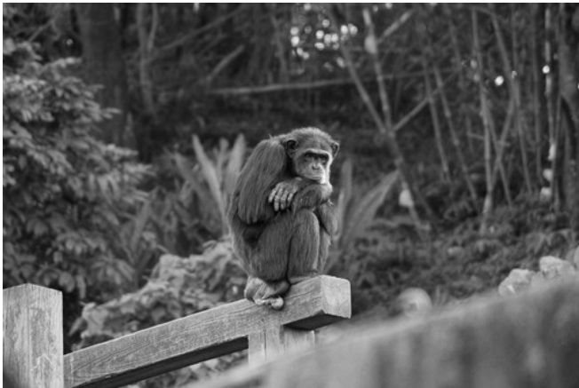
靜靜的等待，看看會不會有奇蹟會發生。