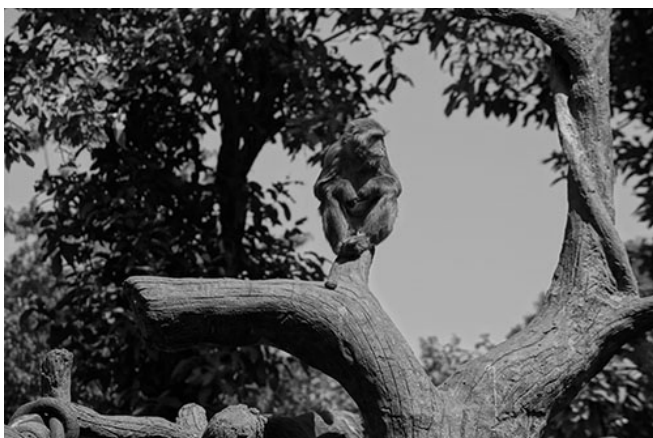
晴天、雨天、大陽天，對他們來說，每一天都是一樣的。

人類常常自私的認為，萬物的存在一切都是理所當然，渾然不知人在享受眼前美好的同時，動物們的生存權已經蕩然無存。