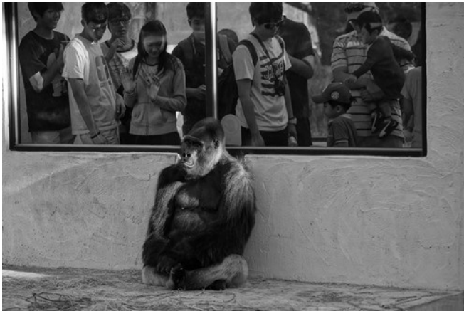
那乾脆不再與人類對抗，靜靜地坐在地上，絕不回頭。