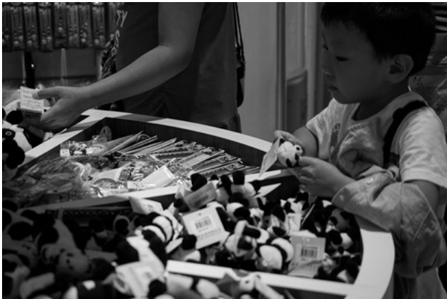
光看無法得到滿足，商人們抓準商機，再次的消費動物。