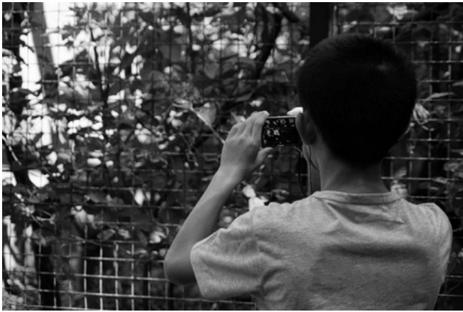
面對相機，也只能任由人類奪走自己的靈魂。