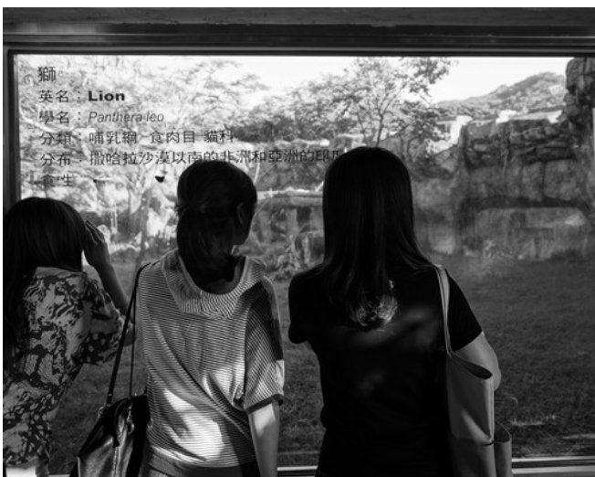
有些動物受不了人類的目光，索性躲了起來。