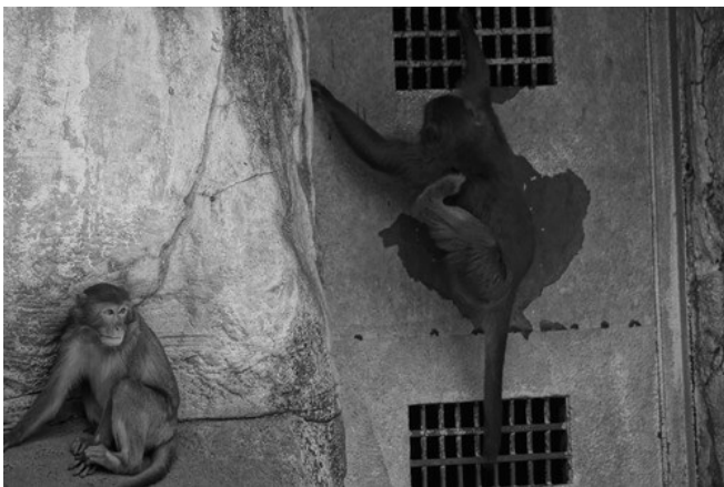
日子還是要過，唯一的期待是下一餐的到來。