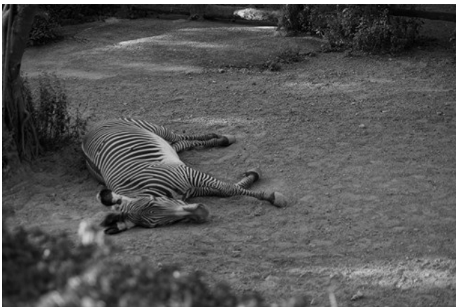
還是說，終究逃不出宿命，只能倒在沒有自由的土地上。