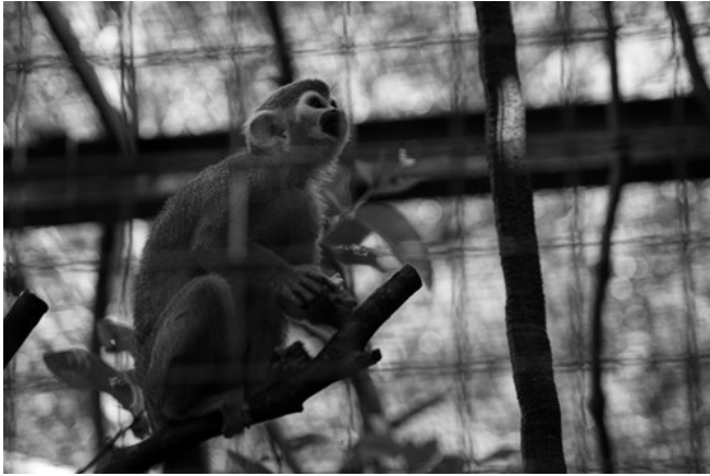
因為自由對牠們來說，早就是遙不可及的夢想。