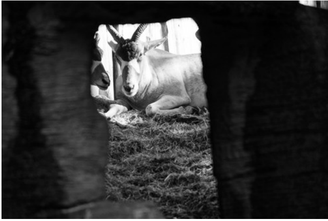
殊不知，就算躲得再緊密，還是會被發現。