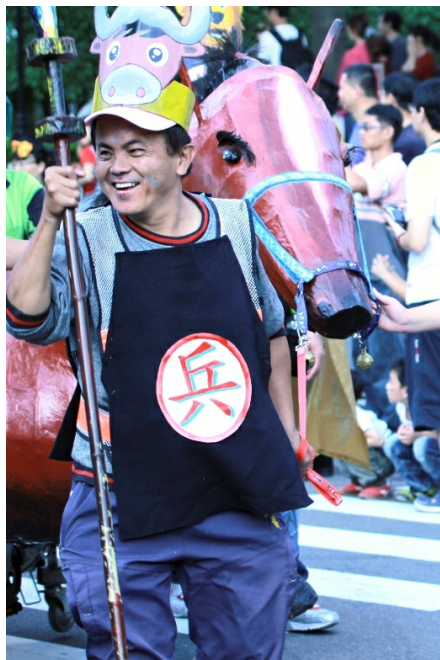
期望遊行結束後，能成為珍惜動物、守護環境的小尖兵。