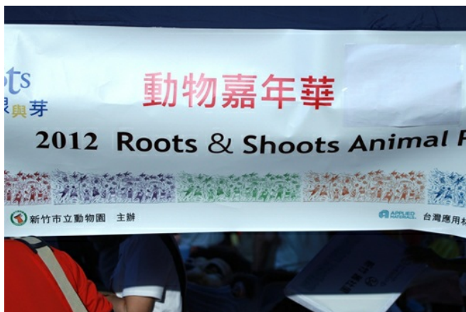
邁入第二屆的動物嘉年華在11月10日盛大展開。

由新竹市動物園和珍古德教育及保育協會舉行的「動物嘉年華大遊行」在十一月十日盛大展開。邁入第二屆的動物大遊行，除了一千五百多位將自己打扮成動物的社區居民及學生之外，珍古德博士也來到現場一同參與踩街活動，希望藉此提醒大眾應該多關懷生命、注重保育生態。現場除了五花八門的面具造型，還有吸睛的大型花車道具，以及台灣本土族群和國際文化元素摻雜其間。