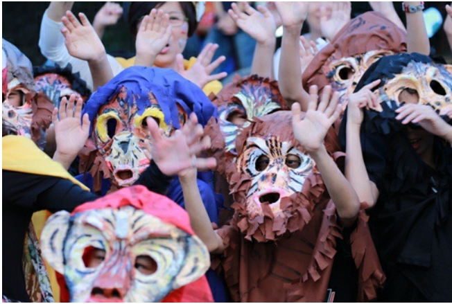
頭帶面具，高舉雙手，模仿動物叫聲，讓整場遊行更加熱鬧。