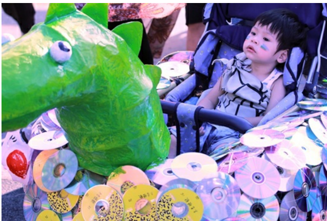
用回收光碟當鱗片，娃娃車成為小恐龍專車。