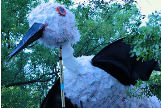
佇立在人群中，高達五公尺的黑面琵琶鷺，羽毛下面貼著花花綠綠的米袋。