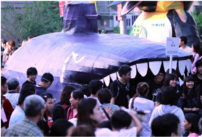
清華大學的「無翅號」，以鯊魚頭加上潛水艇身體的造型，控訴食用魚翅的殘忍。