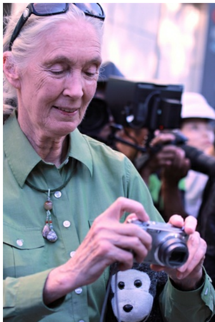
珍古德博士與大家一同踩街，忍不住拿起相機捕捉精采畫面。