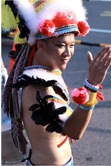
森巴舞者以充滿生命力的表情及舞蹈，為遊行寫下精彩篇章。