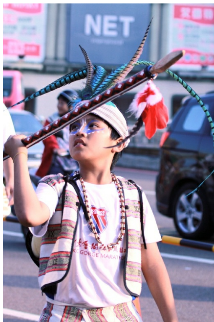
泰雅小勇士，屏氣凝神地專注於遊行中的每個手令。