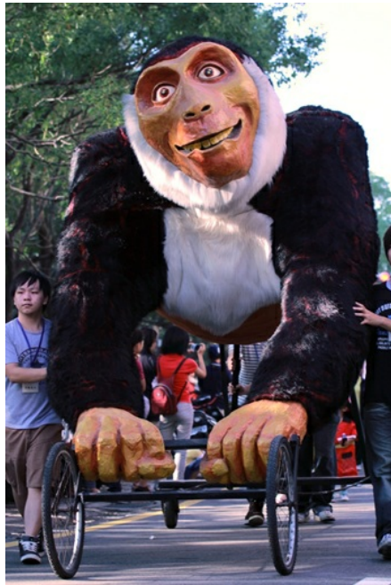
珍古德博士奉獻一生的研究對象黑猩猩造型推車， 奪取全場目光。