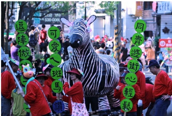
用紙和竹片糊出斑馬，搭配上精心設計的標語相當吸睛。