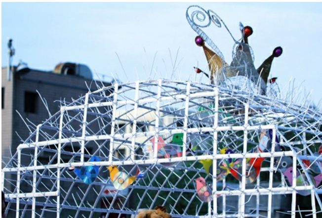
新竹縣橫山國小用竹片編織成鳥籠，打開的門象徵讓鳥類飛出囹圄，自由翱翔。