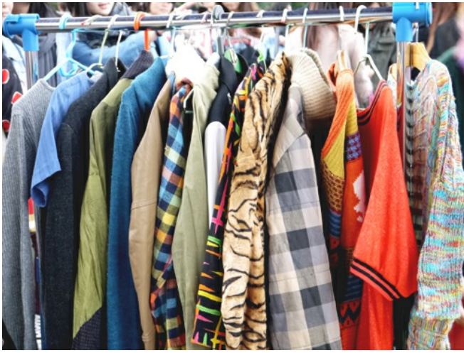
二手衣物隨興地掛著，等待下一個懂它的買主。