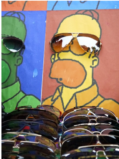
具有巧思的小創意讓人會心一笑。