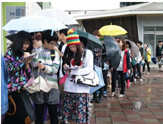
進入市集的第一件事：先寫下自己最愛的一首歌。