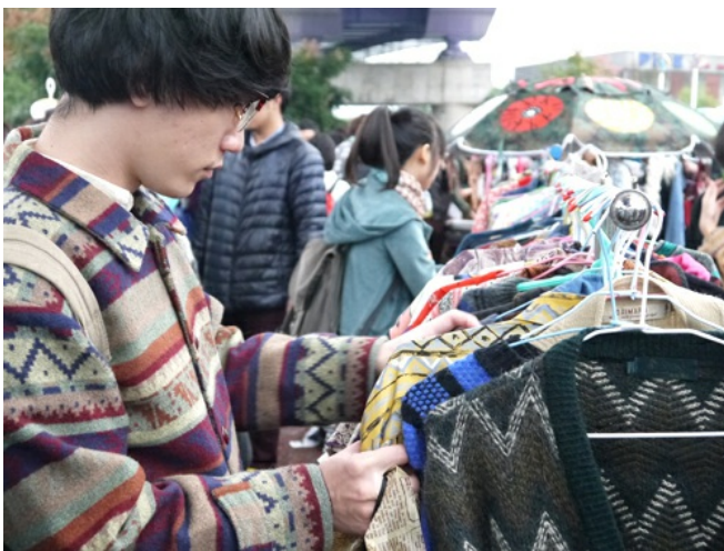
逛二手市集不只是女生的專利，男生也占了很大部分。