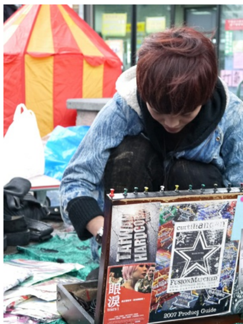
別出心裁的行李箱也是吸睛的關鍵。