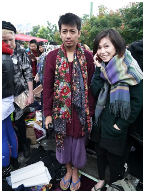
從異於他人的打扮中建立自信，是週末狂潮最主要的宗旨。