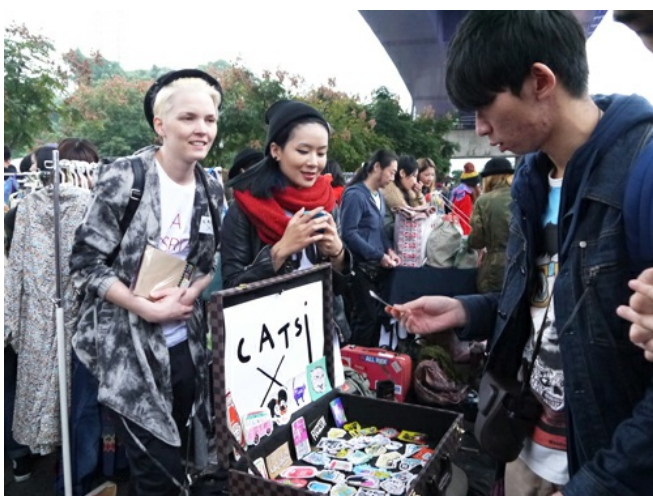
這裡，有來自世界各地的自創品牌。