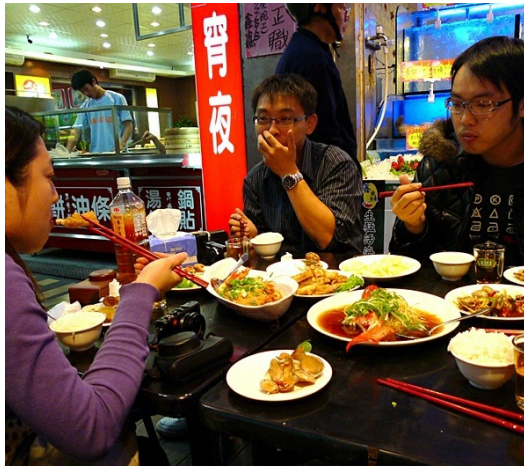
上班族下班後到一定到熱炒店點一盤現炒的宮保皮蛋，和同事暢飲一杯。