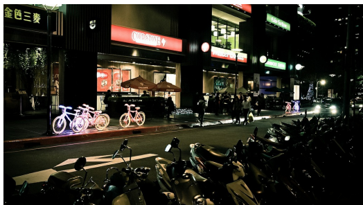
在台灣生活很便利，時間再晚都可以即時找到你急需的物品

體會最深的，就是〈二十四小時營業中〉這一小篇，不得不說其實是因為台灣人的懶散，及沒有一致性的生活步調，而帶動了許多便利，去配合各種各樣生活樣貌的人。書中說道：「三十七年前，你在永和地區就可以找到二十四小時營業的豆漿店。一九八三年後，便利商店也全年無休。一九九九年後，你可以在書店看整晚。二〇〇七年後，你可以在速食店待到早晨再回家。」看到這段文字，突然讓人回過神，其實大多數的人早就把二十四小時營業這件事視為理所當然，卻忽略它人情濃厚的面貌。在台灣生活如此便利，時間再晚都可以即時找到你急需的物品，一出國，便覺得他鄉的夜晚不像台灣如此溫情，處處有燈火通明的店家，招手手要給予你幫助。一股台灣用持續不減的溫度待人的感動，頓時油然而生。