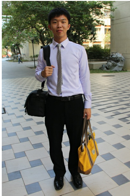
穿上正式衣著，準備參加廠商面試會。