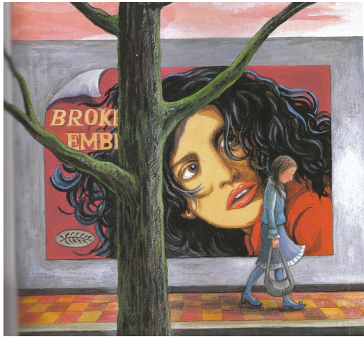
女孩與男孩漸行漸遠，女孩孤獨的走在人行道上。身旁的牆上是阿莫多瓦的電影 《破碎的擁抱》海報。

《時光電影院》用一名女孩一路長大的故事為主線，勾勒現代社會中，每個人都被電影圍繞的浪漫生活。雖然有時電影與現實的拉鋸會相當激烈，但幾米以溫和的方式呈現，也讓書裡的電影成為可以為主角留住溫馨時刻、品味當下溫暖的媒介。電影陪著她盼望親情、守候愛情，同時也是一個很重要的生存喘息的空間。