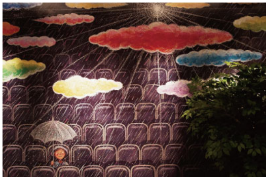
觀眾席的情景描繪，直接呈現電影的氣氛。

幾米的作品讓讀者可以暫時逃離現實世界，但同時卻也讓人是在閱讀的時候，看到現實生活的倒映。雖然幾米畫中的元素很超現實，每個故事裡都有出現一點不真實的情節，畫作裡的題材也天馬行空，但是這些看似「不真實」的景象，其實正好可以反映角色的心境。符合情感的真實，對於創作來說，或許才是確切的真實。