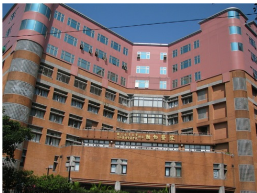
擁有動物醫院的台大是獸醫系第一志願。

由台大獸醫系的最新調查指出，有近九成的臨床獸醫師和學生贊成管制台灣獸醫系的招生總額。因此獸醫師公會聯合會、台北獸醫師公會、台大獸醫系友基金會也針對中國醫藥大學的學士後獸醫學程展開「獸醫教育的未來」研討會。其中，台大獸醫專業學院院長指出：「獸醫系目前推動四年學習、兩年實習的教育來和國際接軌，如果中國醫藥大學的四年制後學士獸醫系通過，將造成獸醫學制的混亂。」台大獸醫系路同學表示，要解決經濟動物獸醫師不足的方法應是從教育著手，而非增加獸醫系的招生名額。