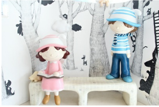
不同時空下，無法觸及依然真摯的陪伴。