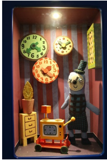
被囚禁在時間的記錄與回憶循環的空間裡。

由於對於過往的偏執，記錄變成了一種強迫的用藥習慣，沉溺於回憶之中則是無藥可救的重度成癮，總是在記錄與回憶間，不斷地加深對於某個曾經的執著，像是被囚禁在毒癮之中吸毒犯，逃脫不了「過去」的誘惑。