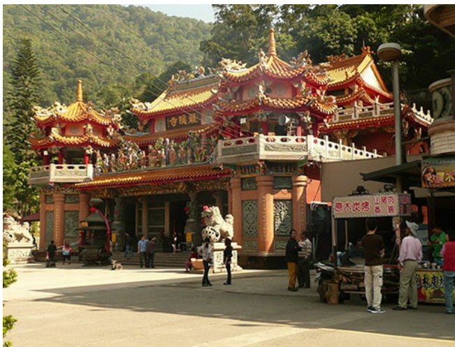
吊橋對面的龍隱寺與一旁賣山豬肉、烤香腸的攤位相映成趣。從很久以前，觸口就是原住民與漢人交易的場所。