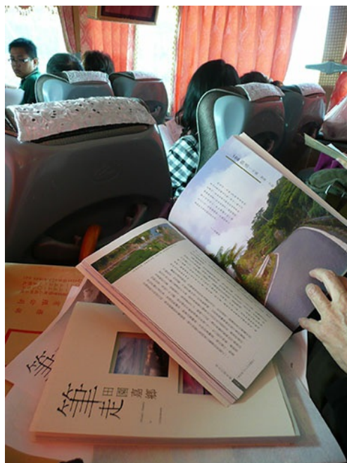
翻開《筆走田園嘉鄉》書頁，遊覽車載著渴望認識鄉土的人們，前往探查文學家筆下的風光。