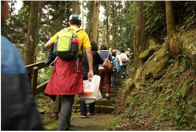
大家一同走上古道體驗林間樂趣。