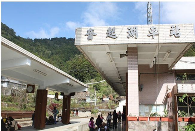
奮起湖車站歷時以久，位於阿里山鐵路中段。