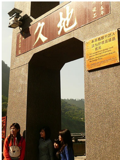
中途停留的第一站是位於觸口的天長地久吊橋。