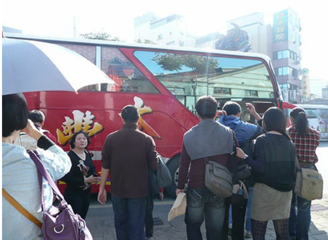
筆走田園嘉鄉營隊參加人員，在嘉義市整隊到齊準備出發。

作家劉克襄受邀，帶領參加踏查的一行人從嘉義市集合出發，一路經過觸口、隙頂到奮起湖，帶給大家不一樣的旅遊體驗。遊覽車行駛在台18線上，劉克襄在整趟車程裡，也不停地分享自己所聽過關於這條路所經過之處的故事。