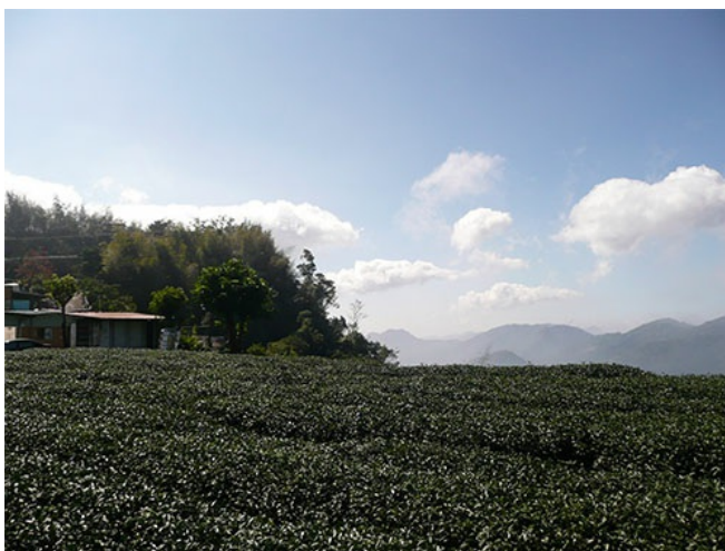
隙頂是一行人的第二個停靠站。隙頂有著許多茶園，是阿里山的茶葉重鎮。