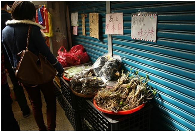
奮起湖老街販賣許多山上特有的農產品。