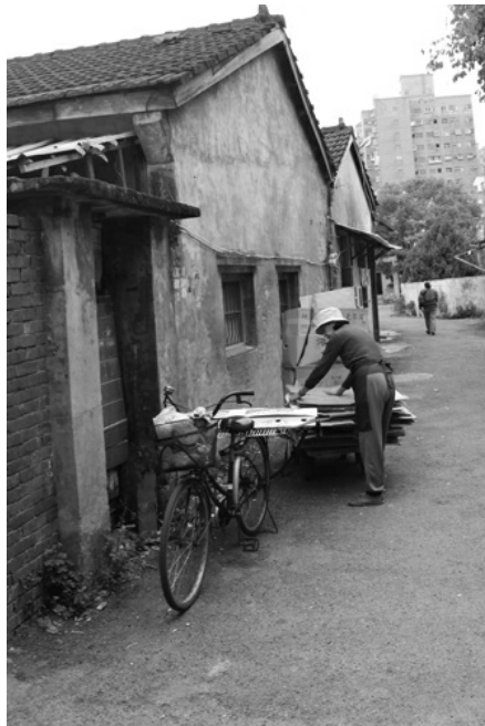
眷村裡僅剩幾家老人，不願搬離。