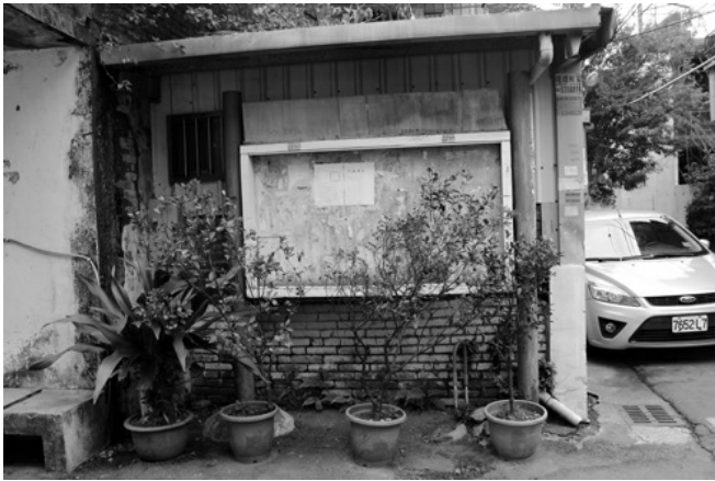
住戶一一搬離的今天，社區佈告欄已失去作用。