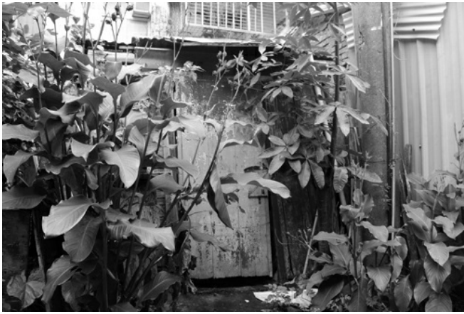
空屋外的植物恣意生長，漸漸擋住房子。