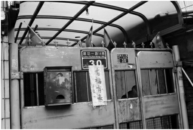
插著國旗的房舍，為眷村一大特色。