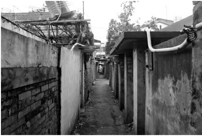
兩人間寬的巷弄，狹長卻沒有人影。