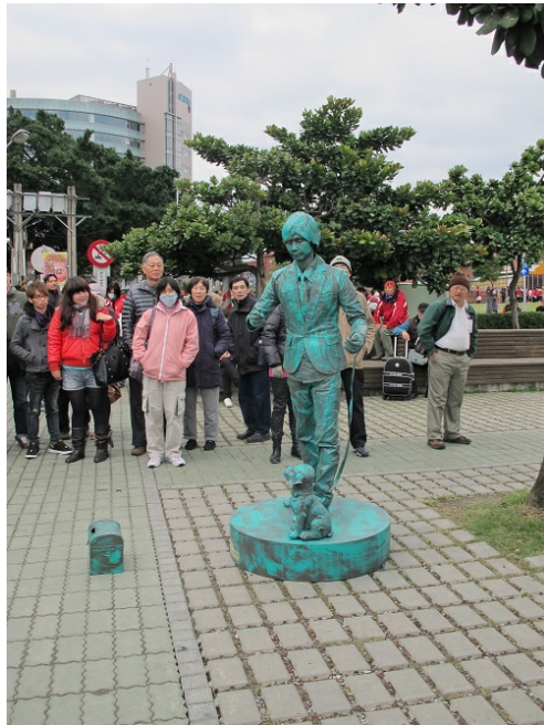
街頭藝人有趣的表演吸引遊客駐足。