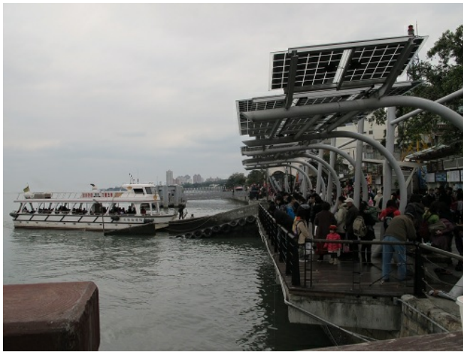
灰濛濛的天氣下，遊客搭船的興致不減，都想看盡2012年最後一天的淡水。