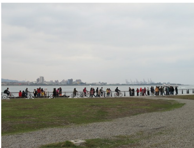
淡水海岸一路陪伴著遊客們，將他們送往漁人碼頭，送往2013年。