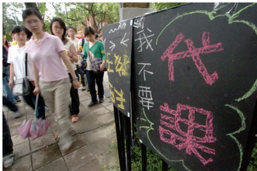
代理代課老師工作相較正式老師十分不穩定。

每年舉行的教甄裡，其中有許多都是徵聘「代理代課老師」。根據中小學兼任代課及代理教師聘任辦法，代理老師以全部時間擔任學校編制內的教師，代理滿三個月後領取月薪。基本上工作內容與時間等同於正式老師。而代課老師則以部分時間擔任教學工作，支領鐘點費。