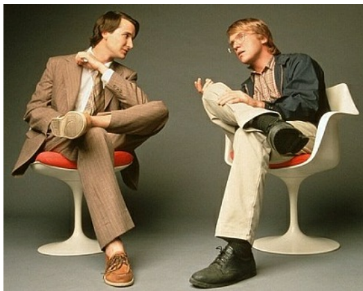
劇中賈伯斯與比爾蓋茲神情專注地談話

賈伯斯在人際關係處理上的缺陷，造成他最後眾叛親離的下場。但是誰也不能說賈伯斯在事業上是失敗的，他對於美學近乎苛求的執著，成就了現在猶如藝術品的一系列商品。微軟公司在電腦系統的市佔率是難以超越的，產品猶如工業化時期般大量製造，幾乎一成不變。雖然微軟與蘋果表面上是競爭對手，事實上這兩家公司不能完全放在一起並排比較，鐘鼎山林，沒有孰優孰劣，僅僅是取決於使用者的價值觀而已。