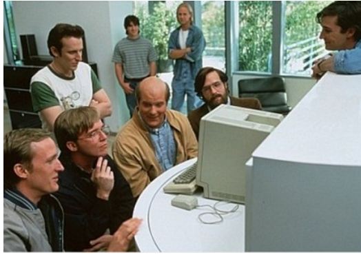
賈伯斯向比爾蓋茲展示圖形使用介面