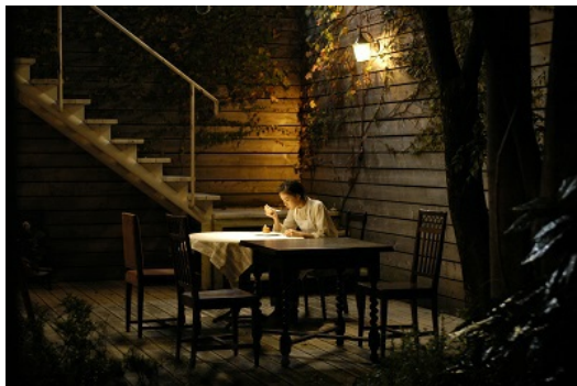
導演擅長以望遠鏡頭表現人物的孤立感。

其他鏡頭的運用上，導演透過望遠鏡頭的使用，成功地營造出角色的孤立感。例如在下目初試做蛋糕時，導演運用大量的望遠鏡頭讓觀眾無法清楚看見演員的表情。觀眾只能透過聲音對話揣測角色的內心情緒，猜測夏日聽到依子說出「我們不賣像聖誕節的那種促銷商品」、「去找個認可你手藝的咖啡廳工作吧！」時，臉上的表情。