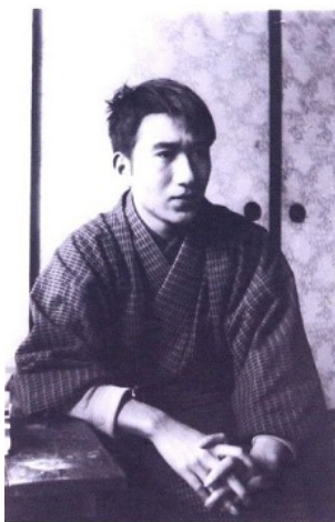
昭和3年頃 下宿部屋にて

太宰治本名津島修治，出身於知名仕紳世家，卻從未享受來自財富或權勢的好處，而是過著酗酒、尋歡作樂的浪蕩生活。而他的作品也總是充斥著一種在黑暗墮落中，渴求著希望的感覺。最為人熟知的最後作品《人間失格》中的主角大庭葉藏，幾乎可以說是作家本身。