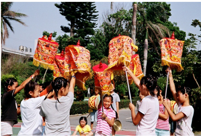
褒忠國小的同學們為了即將到來的花鼓節練習。

雲林的「褒忠花鼓文化節」就是一個很好的例子，褒忠鄉是雲林縣人口面積最小的鄉鎮，但卻是全台灣的花鼓之鄉。花鼓陣當初之所以創立，是地方有心人士為了表現當地特色而發想出來的活動，集結眾人的力量，完成這項團隊任務，當初花鼓陣首辦的時候，鑼跟鈸等樂器還是跟歌仔戲班借來的，舞步也是社區民眾共同發想的。而現在，每到花鼓節時節左右，村內由各組織成立的13支花鼓隊自動自發訓練，不但增加社區居民的情感交流，透過國小國中花鼓隊的訓練，也讓文化素養從小紮根。這類社區自發性舉辦的新興節慶，且不論帶來的實質觀光收益為何，社區居民增加了對地方的認同和情感，即是對地方最溫暖的回饋。