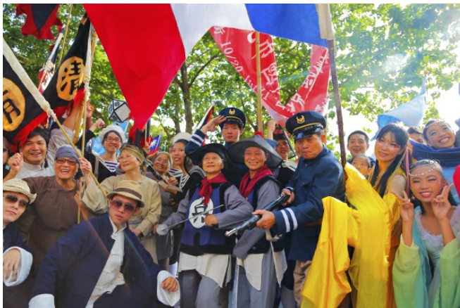
社區居民響應藝術節，秀出清朝戲服，一同踩街慶賀。

這正是節慶凝聚的力量。不只是這群年長的老人家瘋藝術節，社區居民也共同參與藝術節戲碼的演出，而在地表演藝術團隊傾盡資源協助，目的就是為了集結眾人的力量，將淡水最好的一面呈現在全台灣人面前，而2012淡水環境藝術節也被人們評為「庶民可參與的超高水準藝術展演活動」。先不論其訴求的內容是什麼，光是凝聚社區力量、連結人與人之間的情感，淡水環境藝術節即發揮了極大的功能。而活動結束後，因活動連結起的情感卻沒有結束，這群七十好幾的老人們染上了戲癮，自己組成了「清兵退役聯誼會」，持續上演著那段他們老生涯中璀璨的一瞬。