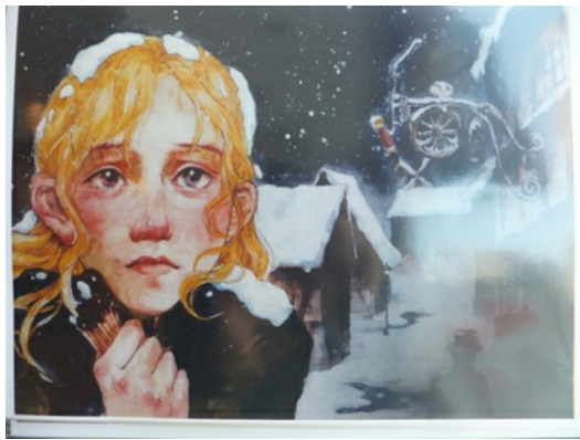
蔡秀雅的賣火柴的小女孩畫作，獲得安徒生童話的獎項肯定。