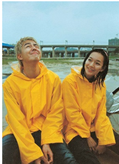
雨天是《瑪德琳蛋糕》中的重要場景。

《瑪德琳蛋糕》故事在一場大雨中展開，還在念大學的男主角吉肅遇見了高中時期的同班同學茜靜，這時茜靜已經一圓高中時代的夢想，成了一位美麗而有自信的髮型設計師。吉肅個性安靜內向，在高中時擔任班長，在大學裡主修韓國文學；而茜靜活潑外向，並勇敢追求自己的夢想一髮型設計師。