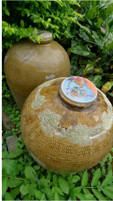
隨處可見的陶甕，徹底將在地文化與學校教育合而為一。