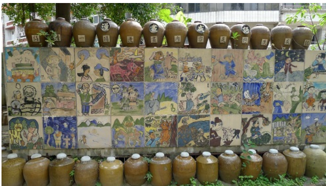
小朋友將成語故事的畫作，以磁磚的方式呈現，有別於以往的紙本閱讀。