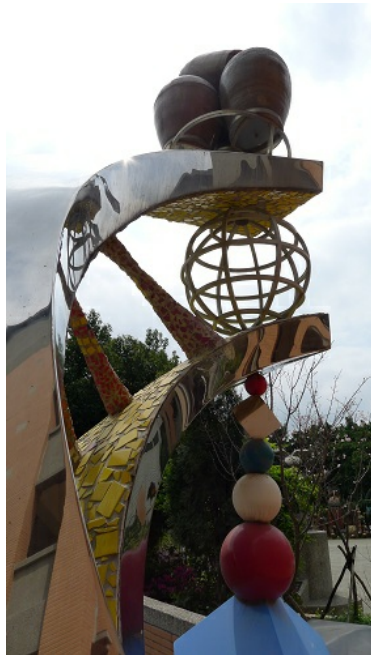
天地方圓，透過方圓之間的相互合作，彼此同心協力，無懼未來的種種考驗。