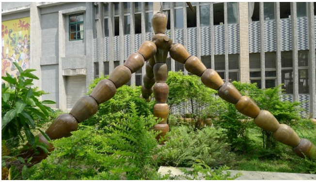
以陶甕為主的裝置藝術，象徵著團結合作的精神。