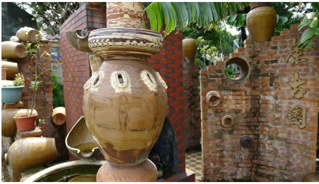
茶古園，是鶯歌國小特色景觀之一，運用陶甕的擺設，呈現古色古香的景色。