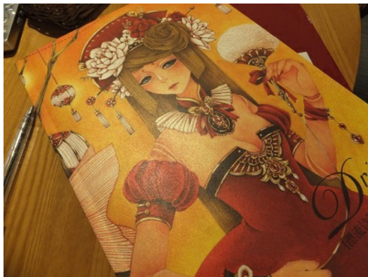
《漂流詩篇》的封面華麗而神祕。

畫中的女孩眼睛透出微光，臉上表情似笑非笑地，有些失望又掛著一絲輕蔑，身上的衣裳和長髮逕自華麗炫目。女孩身後的燈籠閃耀，彷彿有人正在耳邊細語呢喃：「來吧！進來這個世界吧！」悄悄地將人們捲入畫裡的神祕世界。