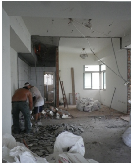
室內裝潢工程都必須謹慎處理，因此有證照才會比較有保障。

設計師的證照分為許多種，計師證照、設計師執照、工作證照等，或是有公司行號則需要公司營業登記證及營利事業登記證。對於如此專業的證照類別及相關資訊，對於消費者而言，其實是非常陌生的，也就造成了現在市場的亂象。因此在委辦室內設計請人家做的時候，最好是請有兩種證照以上的設計師做裝潢和施工，並且時常親自監工並溝通進度，才是對於自己的保障。