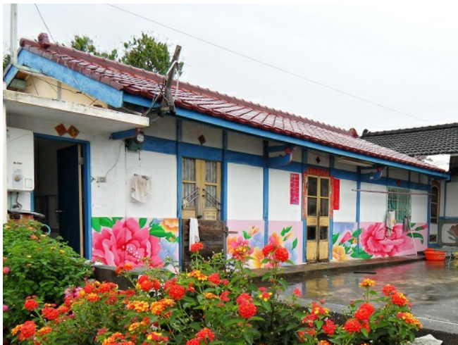
土溝村部分區域主題為《阿嬤的厚棉被》，牆面畫滿復古的粉色牡丹大花，象徵給歸來遊子溫暖的擁抱。