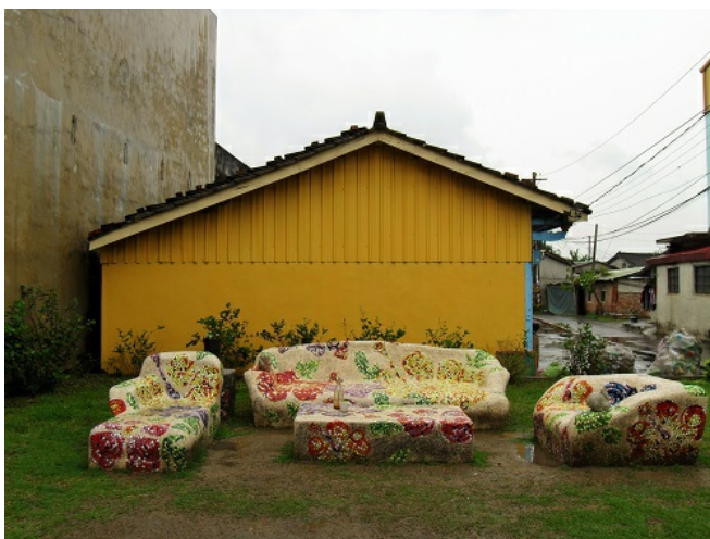
室外沙發收攏一季的春意，在路旁叨叨絮語。