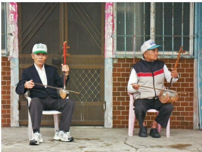
巷弄裡的阿公們在小雨微潤中拉起二胡，樂音輾轉悠盪。