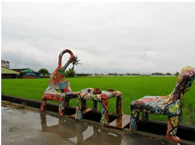
在疏水道上乘涼談天，享受十分鐘陶淵明般的優閒自然。

台灣首座農村美術館座落在台南市後壁區土溝里，在2012年開創《村之屋當代藝術展》。以「美術館是村，村是美術館」的概念，把藝術融進農村生活，將鄉間小路作為文化藝廊，在稻田、磚牆、三合院裡展現台灣小鎮獨特的生命風景。隨著日出日落，旅人們走訪觀賞鐵雕、攝影、裝置藝術，聆聽地方草根的文化脈搏，實踐新農村生活美學。