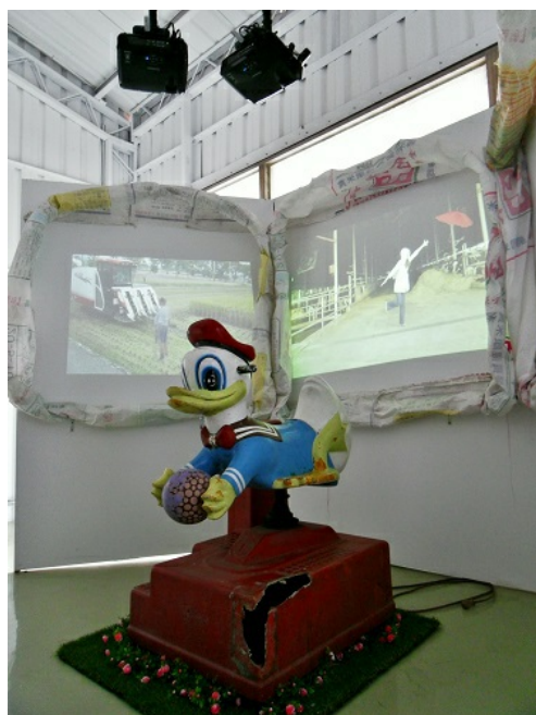
一寸寸挪動的身體是脫軌的漂浮；藝術家們在室內展場延伸自由的定義。