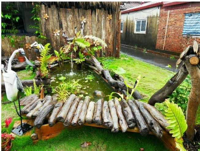
以檜木為基本建材，處處散發溫潤樸實的香氣。