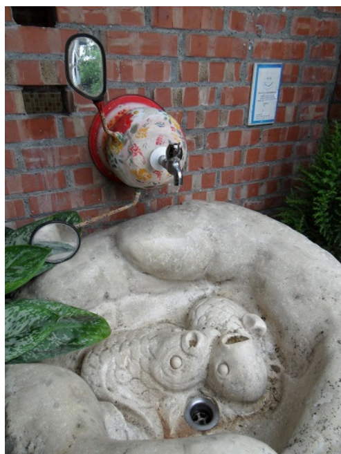
拼接創意的洗手台，也饒富農村式的幽默。