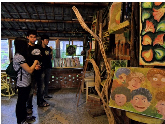
《土溝客廳》溫暖的氛圍，給人舒適的安全感。