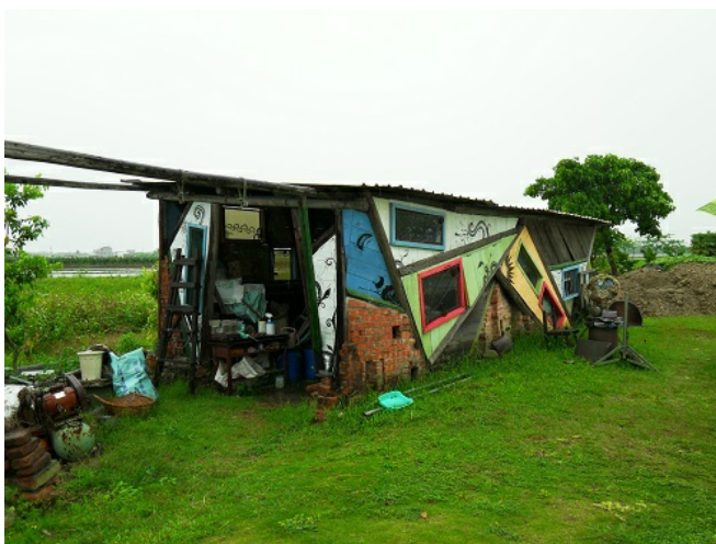
駐村藝術家獨力建造的創意工作室，利用自然色系的拼貼手法，與農村光景合而為一。