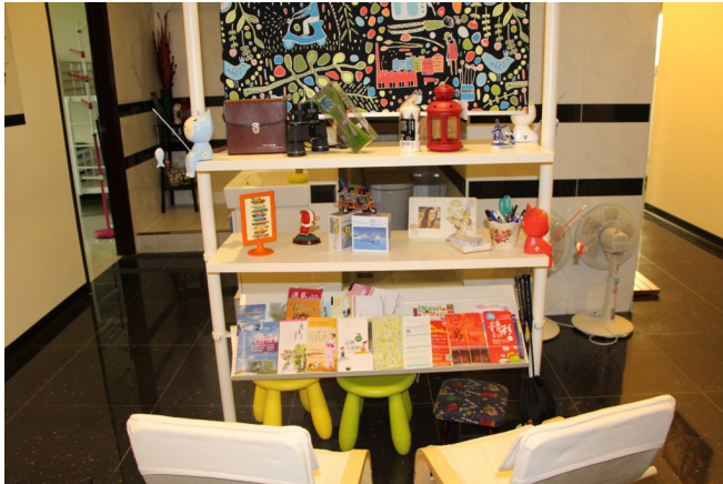
架上擺設許多旅遊資訊，有許多語言版本，提供給住宿客人，並且提供小椅子以便查詢資料。

以低廉價格搶攻旅客住宿市場的背包客棧，除了要和他人共睡一間之外，背包客棧還有著許多和一般旅店不一樣的地方，在背包客棧中的生活究竟如何呢？透過溫馨的氣氛吸引更多旅客，台灣背包客棧用不一樣的方法行銷台灣，讓外國人知道台灣的美。