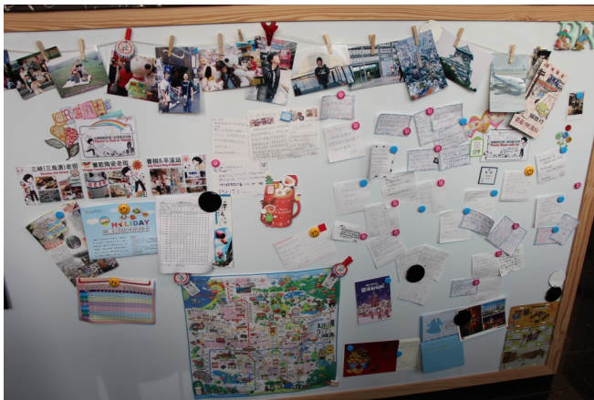
不少旅客留下感謝背包客棧老闆的紙條，有些還會寄旅遊中的明信片、照片回來。