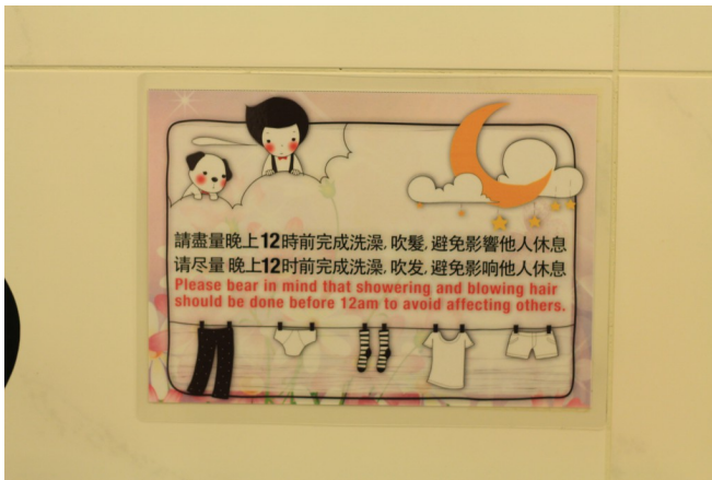
為了使大家有舒適的住宿環境，溫馨提醒是必須的，並透過中英雙語減少看不懂的情形。