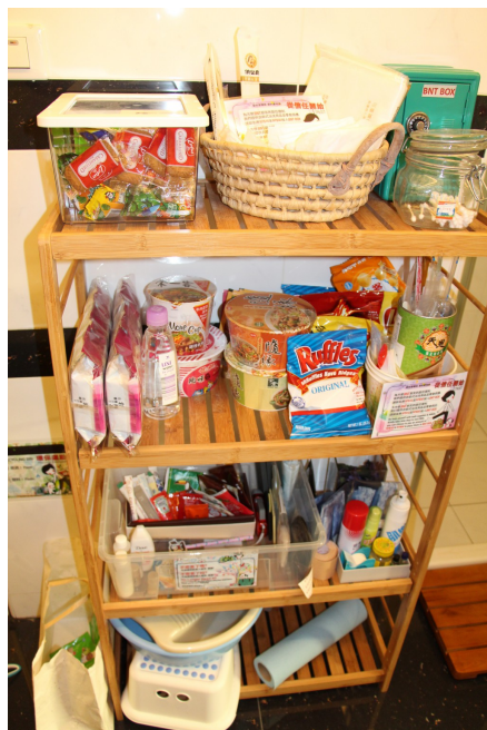
自助式的「便利商店」，擔心住客會少帶東西，拿了東西後自己將錢投入存錢筒即可。