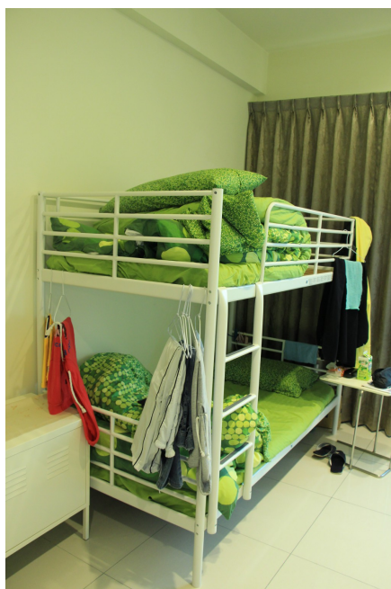
節省空間的好方法，上下舖的床，讓一間房間可以有更多