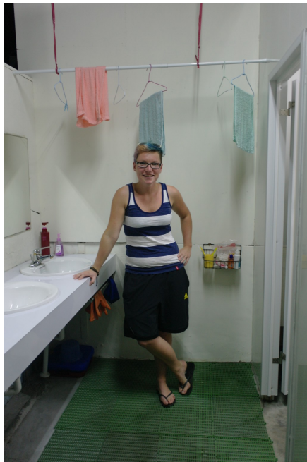
在背包客棧裡，少不了金髮碧眼熱愛旅行的外國人。