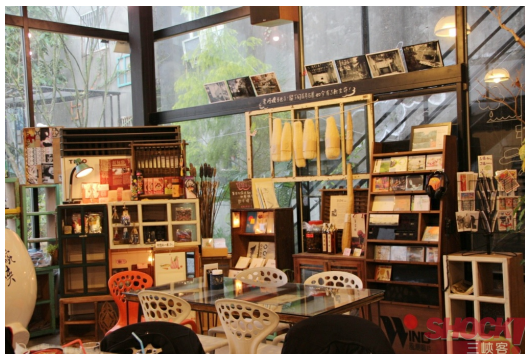
甘樂文創內部空間溫暖明亮。

在歷史氣息濃厚的三峽，有更多值得探訪的文化暗藏其中。稍稍遠離最繁華的老街觀光區，位於水岸旁的甘樂文創，是三峽地區新興的文創基地。甘樂音樂電影食堂結合餐飲、藝文展演、在地關懷、藍染推廣、獨立出版，將各文化領域牽引至餐廳內，讓餐廳不只是飲食空間，而是浸淫文化脈絡的場域。「甘樂」二字為陀螺的台語發音，希望人們在忙得團團轉的步調裡，體驗甘之如飴的幸福。