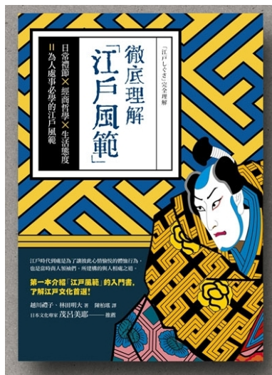
《徹底理解「江戶風範」》書影。