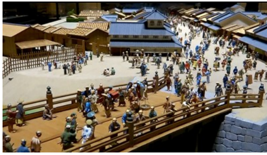
在人口眾多、文化複雜的江戶，人們努力學習如何融洽的相處。