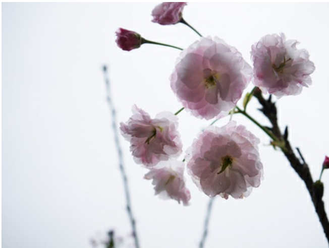
部落引進多項不同品種的櫻花試種，期望能使花季延長，吸引遊客駐足。