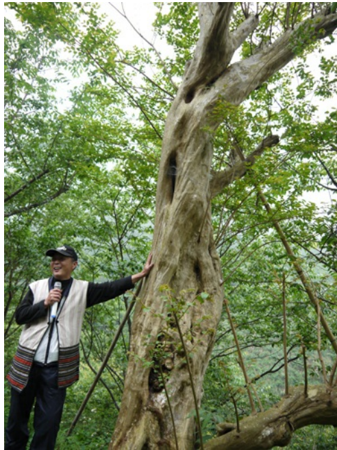
志工帶著遊客到山林間散步，欣賞大自然美景，沿途介紹野生動植物。 不同於一般熱門景點，社區旅遊更強調其深度。