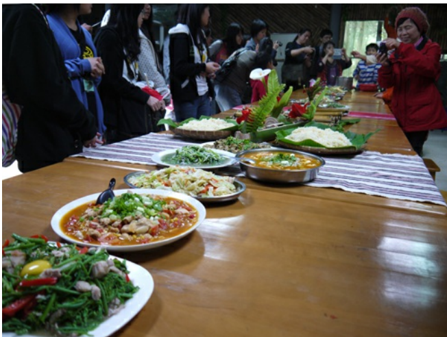
原住民風味餐也是發展勒俄腊社區旅遊的亮點之一，竹筒飯、勇士湯、高山有機蔬菜， 緊緊扣住遊客嘗鮮的味蕾。