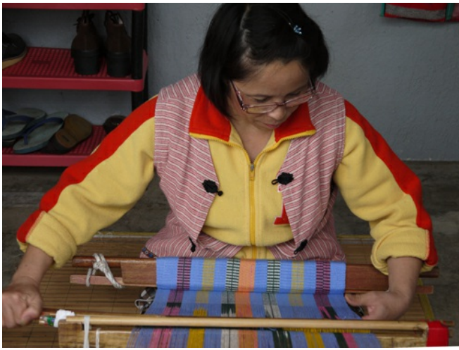
泰雅織布聞名中外，然而這項傳統技藝現正面臨失傳的危機，五峰鄉內熟稔傳統織布手藝的泰雅族婦女屈指可數。