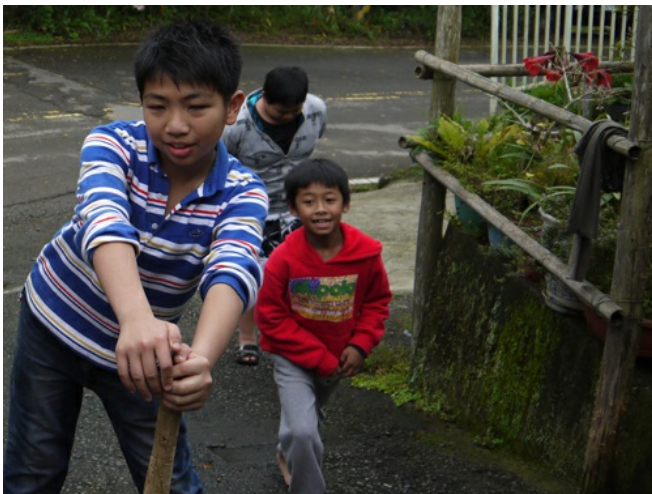
勒俄部落的知名度逐漸打開，假日雖有遊客造訪，但部落小孩依然怡然自得地 在一旁玩樂，更顯得部落的純樸可愛。