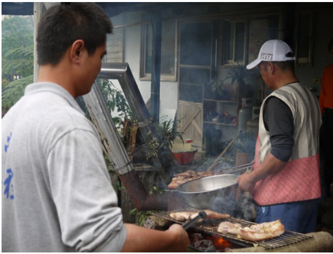
炭烤山豬肉是原住民美食中不可或缺的一部份，陣陣撲鼻的香氣令人垂涎三尺。