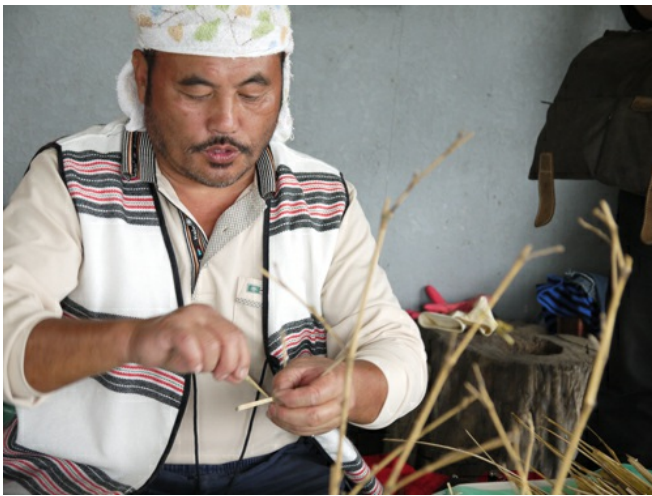
竹編是以前原住民小孩的玩具，瞧長老信手拈來便是一件精緻的作品，但不少遊客可是手忙腳亂，只差手指沒打結而已。