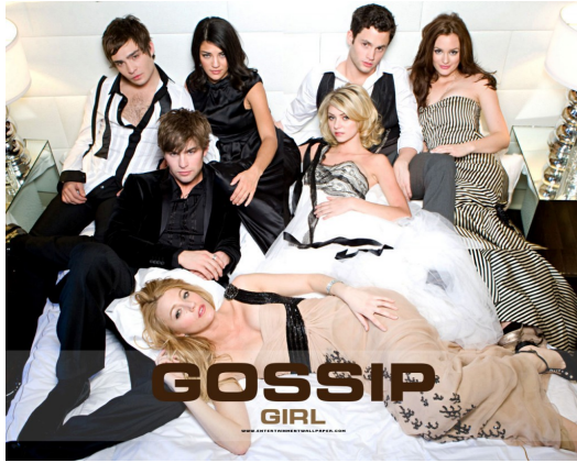
Gossip Girl海報。