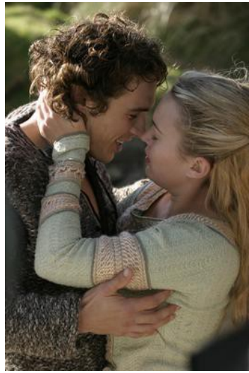
崔斯坦和伊索德寫下不朽的愛情篇章。