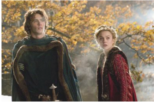
崔斯坦面臨了忠誠與愛情的兩難。