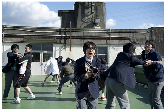
義無反顧、勇往直前的前田精神。

相較之下，宏樹身為桐島的摯友卻不知道桐島為什麼退社了，加上對未來的不確定性與恐慌，雖然身為棒球社員，也一直背著棒球包，但是每次遇到隊長的邀請都猶豫不決，雖然最後想參賽，不過機會也早已不在了，始終無法表達他的渴望，他說過「有能力的人做什麼都行，沒能力的人做什麼都不成」，劇中的他雖然有能力，但是什麼也沒做成，也許是因為害怕失敗、害怕冒險、害怕別人的眼光，而使他卻步，這種壓力也讓他迷失了自己。