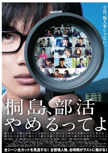
消失的桐島，掀起一段青春的騷動。

青春，是人生必經的過程，在這趟名為「青春」的旅程當中，每個人多多少少都有屬於自己的印記。那個曾經對未來的迷惘，對愛情的不安全感，對友情的悵然若失等等，都深刻的呈現在《聽說桐島退社了》這部改編自朝井遼所寫的小說。描述一位排球社社長桐島，在一個平凡的星期五，突然在校園中傳開他退社的消息，所引發一連串的連鎖反應，而他周遭的同學們，又會面臨什麼樣的人生考驗呢？