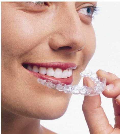
隱適美牙套透明的特點，成為愛美但又需矯正民眾的最愛。

一般最常見的是金屬矯正器，除了價格便宜，加上摩擦力較小使矯正時間縮短，常廣為學生族群使用，但因為金屬矯正器常被認為較不美觀，所以又有了其他矯正器，如陶瓷矯正器、水晶矯正器、舌側矯正器，甚至最近幾年有了所謂「隱形」牙套之稱的「隱適美」牙套。隱適美利用3D影像科技，患者只需每兩個禮拜更換一次牙箍，而且牙箍擺脫刻板印象，以「透明」、「可隨時取下」作為標榜，讓愛美的女性頗為心動。但天底下沒有白吃的午餐，隱適美的價格為一般金屬矯正器約一到三倍左右，廣為藝人、空姐或是需要和顧客密切接觸的職業所使用。