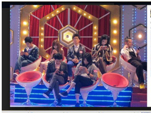
藝人韋禮安在錄製電視節目空檔時，孤單一人被層層低頭族包圍

而手機商也憑著報章電視廣告，灌輸未使用智慧型手機是落伍的觀念，手機發表會中所提出的新機種也都以智慧型手機為主。二〇一二年有媒體拍攝到一張照片，在等待節目錄影的空閒時，藝人韋禮安正襟危坐地直視前方，其他周遭其餘藝人都低著頭把玩著手機，如此強烈的反差，道出一般非智慧型手機使用者平常的寫照。