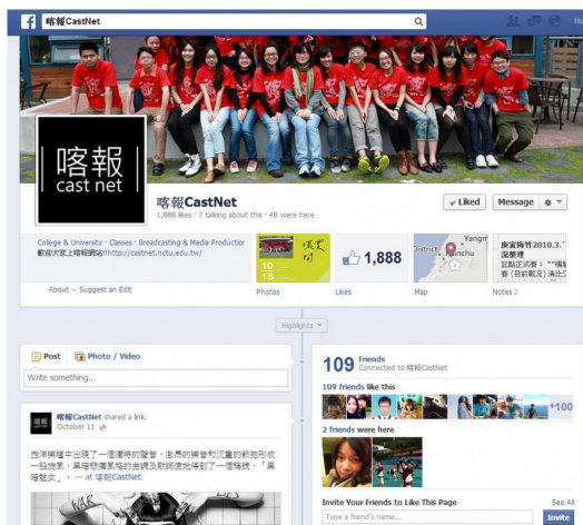
各式各樣的粉絲專頁林立，宣傳與分享各自的想法。

然而不只是商品，許多名人，甚至素人也架設起個人專頁，當作部落格和「粉絲」們分享作品或生活中的點滴。基於最初的宣傳目的，粉絲專頁的設計使所張貼的文章曝光率明顯高於傳統的部落格，私密性也因此降低。雖然人人都有發表言論的自由，但這樣坦蕩蕩地公開個人生活的行為，令人不免擔憂其隱私問題，同時也疑惑專頁管理人的目的。