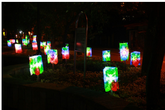
較具抽象概念的裝置藝術，一般民眾可能無法體會涵義。

對於布置一件裝置藝術品來說，需要耗費相當大的時間與心力。然而若不是長久的陳列，而是短期的展覽，則需要利用更多的資源。有些媒材不容易取得，所使用的金錢更是一筆可觀的數字。如果使用的媒材又是消耗品，在四處拆搭的佈展歷程中勢必造成浪費。