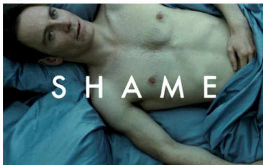
《性愛成癮的男人》劇照。

近十年以來，探討性成癮的電影紛紛出現，包括二〇〇五年幽默諷刺的《我是性癮者》、二〇一一年沉重震撼的《性愛成癮的男人》，還有即將上映的《性愛成癮的女人》。這些聳動入骨的片名，表面上似乎希望藉此吸引些因為演員會有大膽裸露鏡頭，而有興趣的觀眾收看。但影片背後其實懸著一個讓人擔憂得社會成癮現象，就是身陷性愛情慾編織得各種枷鎖而無可自拔。