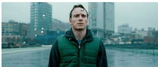
電影《性愛成癮的男人》的男主角在面臨性成癮的種種無助時，崩潰跪地哭喊，

性愛成癮不同於其他癮症是因為它不容易被察覺。特別是現代人善於隱藏自身脆弱的性格，這種會被大眾視為下流、無恥的心病，更是讓性成癮受害者把傷痕苦痛往心底深處藏。成就了一群外表光鮮亮麗，內心卻如腐肉堆疊成得黑洞，萬般腥臭。電影《性愛成癮的男人》的男主角在面臨性成癮的種種無助時，崩潰跪地哭喊，但他的哭喊卻是無聲的，這般的無聲勝有聲，那種悲哀與淒涼如此強烈。觀眾或許不了解性癮是什麼，但那種深刻地痛楚會讓人糾結，究竟男主角不願解釋的過往留給他什麼樣的影響與傷痕，讓他如此不堪。