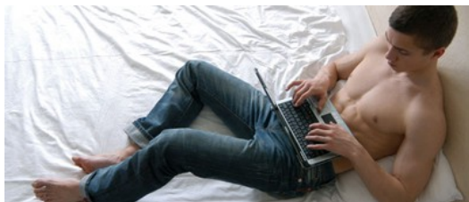
網路發達導致網路色情俯拾即是。這些色情網站的內容會潛移默化地影響觀看者的心靈。

只是這樣的模式長久下來，成癮患者漸漸會發現，再多的性也只能滿足當下的癮頭，就如同吸毒般，明知道吸食後果慘痛且會無以復加地放大空虛無助的感覺，卻忍受不了一時，而選擇痛苦一世。