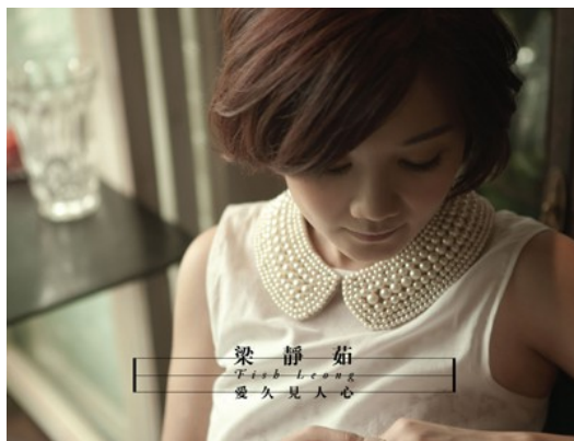
療癒系女聲梁靜茹最近幾張專輯，以嶄新姿態述說愛情。

這些年劉若英的歌曲，帶領歌迷見證了一份最真實的感情蛻變，這樣的轉變和風格也讓人聯想到另一位歌手梁靜茹。梁靜茹從〈勇氣〉、〈無條件為你〉到〈分手快樂〉和〈可惜不是你〉，還有近五年來的〈別再為他流淚〉跟〈愛久見人心〉等歌曲，同樣可以看的出一個女生如何在愛情與生活中變的堅強、獨立又有想法。