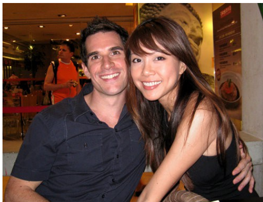
現今流行的跨國戀愛，可看出對歐美國家的崇拜。

歐美國家的人有著白皮膚、金頭髮、藍眼睛，臺灣人看到他們都會不由自主地多「欣賞」幾眼。但相反的，遇到外籍勞工，通常都會皺著眉頭退避三舍，嘴裡嘖嘖著香水味好重，深邃的五官卻好像視而不見。從文化的角度來看，歐美國家不管是科技還是產業發展都是世界上數一數二的，加上好萊塢電影常常上演他們運用高科技改善人類生活，或者是迷人且便利的現代都市等場景，都讓觀眾覺得他們引領著世界潮流，而開始崇拜嚮往這樣的生活。因此不管是來臺工作還是觀光，只要是金髮碧眼的外國臉孔，總能得到臺灣人友善熱情的對待。最近，還吹起了CCR的熱潮（CCR是指Cross Cultural Romance，也就是跨文化戀愛），好像不管什麼東西只要和歐美扯上邊，就是流行時尚。