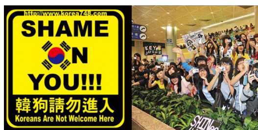
臺灣人對韓國人的態度十分矛盾，既反對又崇拜。

至於對韓國人的態度，更是錯綜複雜。在科技方面，韓國和臺灣互為競爭對手，自然常常會秉持著「愛用國貨」、「台灣尚好」的心態去抵制韓國產品。而在舉辦國際運動賽事時，這種國族意識又更加明顯，尤其韓國在比賽時常常會有作弊的舉動，使臺灣人更加不齒，不但在比賽現場高舉著「打倒韓國狗」等不雅標語，還會在社群網站、部落格上發表一些激進的文章，甚至發起拒用韓貨的活動，但卻在知名韓國團體發行新專輯之後，這些事又好像從來沒有發生過。韓國團體在臺灣流行音樂界掀起一大熱潮，每次來臺開演唱會，儘管票價昂貴，仍然馬上被一掃而空，明星到機場時，還會有瘋狂的粉絲排隊接機。MV中的舞蹈也時常成為表演的素材，除此之外，韓國藝人的穿搭也成為時下年輕人模仿的對象。韓國和臺灣的關係，有時候像是有著深仇大恨的敵人，有時候卻又是讓人臉紅心跳的偶像明星。