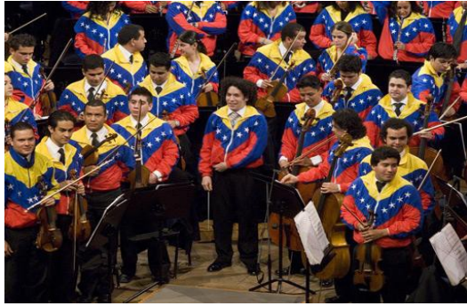
杜達美與西蒙·玻利瓦青少年管弦樂團演出，受全世界樂迷熱烈歡迎。