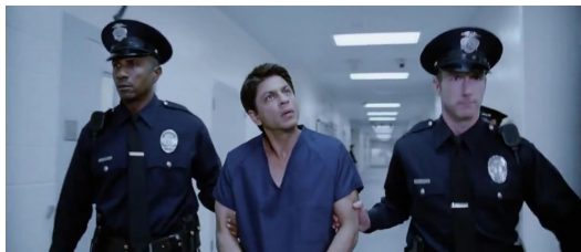
在旅途中，里瓦茲被看成可疑分子遭到逮捕。

里瓦茲是穆斯林，是一個捐出三千五百零二元美金，並為九一一罹難者祈禱的穆斯林。但是他的兒子卻因為「可汗」這個姓，在學校備受欺凌，最後被霸凌致死。里瓦茲穿著他送給兒子的足球鞋，去見總統的旅程中，也因為穆斯林這個身分到處碰壁，甚至被當成恐怖分子送進監獄質問。可是一般公民想見總統又有甚麼錯？「你要記住，世界上只有兩種人，好人和壞人。」里瓦茲的媽媽曾這麼跟他說，他一直都謹記在心，但卻不是每個人都這麼分類。