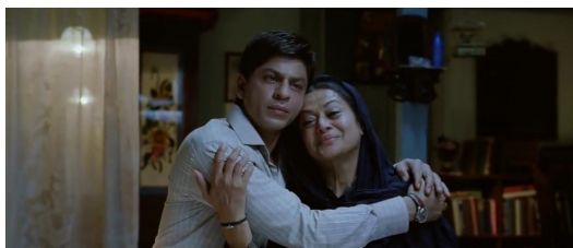
媽媽要求里瓦茲再多抱兩分鐘。

在媽媽想念在外面工作的弟弟時，里瓦茲輕輕地抱住她幾秒，隨即放開問：「這樣好點了嗎？」媽媽央求他多抱兩分鐘，他看看手錶考慮，答應了。在里瓦茲的兒子送到醫院急救時，醫生說是脾破裂，他便立刻跑去查脾破裂的意思及急救方式，再回來背給曼德拉聽。他用他的方式，關心對他來說很重要的人。他也知道他不懂長用言語表達，所以把想對曼德拉說的話寫下來，希望曼德拉可以感受到他的愛。