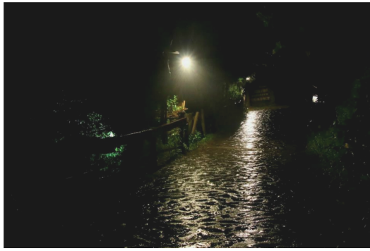
旅行也是一種尋找歸屬感的方式。

如果問家是什麼，有人會說有床的地方，也有人會回答家人在的地方。有些人去旅行的原因是尋找歸屬感，也就是一個家的感覺。因為全球化下使得傳統的情感維繫不再如此堅固，人們渴望找到自己真正的歸屬。許多人旅行到了某個地方，停下腳步就決定住在那裡，也有人回到台灣之後戀戀不忘去過的地方，因此開了一間異國餐廳或咖啡店。