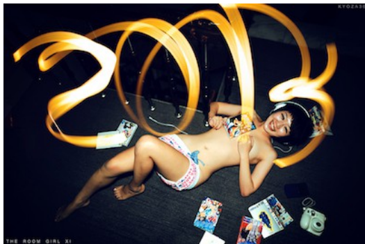
Room Girl系列創作之一，為了拍出自己滿意的二〇一三光雕字樣，

開始在模特兒們的房間拍以後，陳紀東發現這樣做有許多好處，因為汽車旅館有時間限制，在家當然就不需要顧慮時間，而服裝上也多了許多選擇，「女孩的衣櫃一打開總是滿滿的有上百種搭配任你挑。」陳紀東說：「而且每個女孩的房間風格是很不一樣的，可能這個女孩看起來很酷，可是房間裡卻擺滿Hello Kitty。」但是，在模特兒家中拍，偶爾也會遇到一些出乎意料的狀況。「有一次就是在家裡拍大尺度的寫真，拍一拍突然模特兒的爸媽回來了，就緊急應變一下說是朋友之類的。」陳紀東說到當時的情況，還是不免有些尷尬。