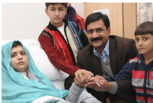
馬拉拉平安度過危險期，在病房裡與家人團聚。

「我大多數的同學都想成為醫生，實在很難想像誰會把這樣的事看成是一種威脅。」塔利班份子認為女孩子不應該上學受教育，而馬拉拉卻無法認同。《可蘭經》裡認為人們都該受到平等的教育，而塔利班卻扭曲經書上的意義，他們比一般百姓更知道教育的重要，所以塔利班懼怕文字的力量。馬拉拉很希望讓所有男女都能接受教育、讀懂聖經，如此一來，即使有心人士背後操弄，虔誠的民眾也能靠著自己對經文的認知來辨識真偽而不被操控。馬拉拉為捍衛平等教育挺身而出的作為，等同於將自己陷入與塔利班對峙的局面。而直到現在，巴基斯坦境內依然認為捍衛女性教育權益的想法違背伊斯蘭教義，因此馬拉拉還有很漫長的道路要走。