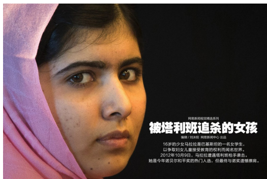
為了捍衛教育而遭到追殺的少女馬拉拉·尤素福。

二〇一二年，少女馬拉拉·尤素福為了女性受教育的權利而四處奔走替女性發聲，卻在家鄉遭到塔利班槍擊一度性命垂危。當時在生死關頭徘徊的她，奇蹟似地存活下來，如今走在復健艱辛道路上的馬拉拉更出版自傳《我是馬拉拉》一書，透過文字的力量幫助受到不正義對待卻只能保持緘默的女性們尋找一個通向文明的出口。