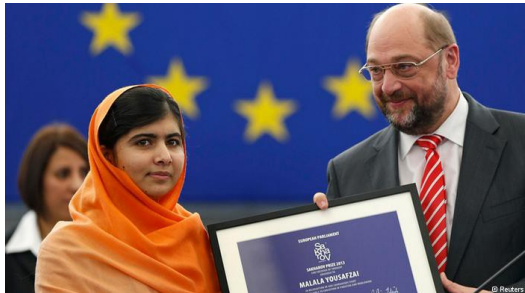
二〇一三年十一月二十日，馬拉拉獲頒歐盟最高人權獎薩哈羅夫獎。

「一個孩子、一位教師、一支筆和一本書，可以改變世界，教育是唯一的解決方案，教育優先。」塔利班的操縱讓馬拉拉看見無知的結果就是淪為犧牲者，她知道世界上不是只有拳頭、武器擁有力量，筆和文字的力量更勝前者。