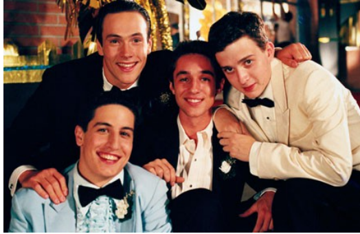
四個主角分別象徵四個不同的愛情觀。

許多美國高中生因為朋友間互相施加的壓力，加上媒體大肆渲染下，往往將性過度地美化，在身心都還未準備好的情況下就發生了第一次的性行為。這種不是因為愛而發生性行為也因此形成為美國青少年的特有文化，間接影響了日後的對愛情所持有的態度。威茲巧妙地用四個因為不同原因而發生第一次性行為的主角，勾勒出美國社會愛情觀的縮影。