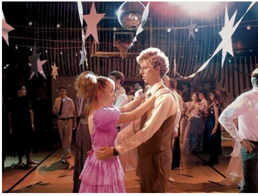
畢業舞會對美國高中而言，是很重要的里程碑。