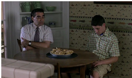
吉姆在試圖用蘋果派自慰時被父親逮個正著。

整部電影的主軸環繞在四個即將畢業的高中男性，討論如何在上大學前脫離處男之身。吉姆是一名只要女性和他講話就會手足無措的男孩，每次想要自瀆時總會被父親抓個正著；保羅是個驕傲又自以為是的雅痞，卻因為同學的惡作劇將自己在女生面前的形象毀於一旦；凱文和他即將因上大學而分離的女朋友卡在三壘（男女關係進展至擁抱親熱）無法突破；而克里斯在身為棍網球主力球員的同時，也想追求一段浪漫的愛情。聚會時，克里斯向大家分享踏上三壘就像在品嚐一塊柔軟的「蘋果派」後，四個高中死黨誓言要在高中畢業舞會結束後成為一名「真正」的男人，一嘗那銷魂的滋味。