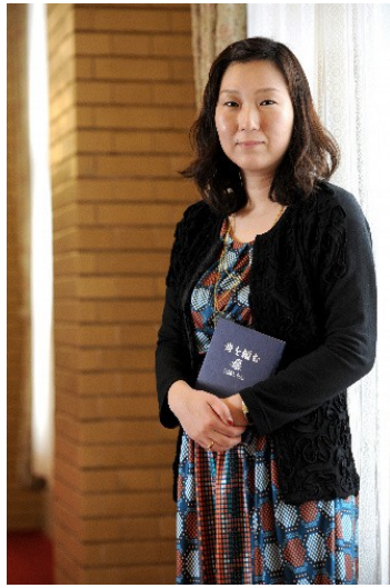
擅長刻畫人物情感的三浦紫苑是日本的新銳作家。