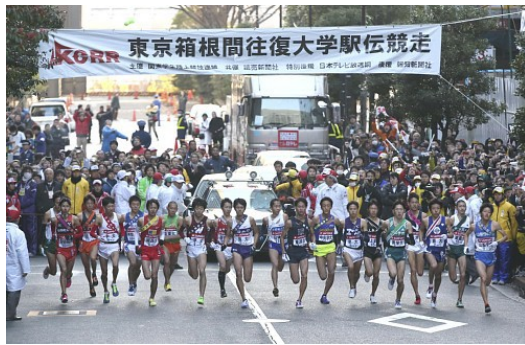
歷史悠久的箱根驛傳至今仍有許多參賽者。

時因律令制度崩壞，原本的驛站失去管理，改為其他機關取代，養馬功能消失，傳達指令等事宜，只好換成由人快步傳遞。而驛傳便是以此為基礎所發展的競賽，跑者必須憑藉自己的雙腳跑過起伏的地形，抵達下一個中繼站，將身上的接力帶傳給下一位跑者，缺少其中的任何人都無法完成。