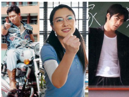
《麻辣教師GTO》、《極道鮮師》和《麻辣鮮師》（由右至左）中主演的三名老師，劇中他們不見得是最完美的教師範本，卻深受學生喜愛。

主要利用教師獨特背景做發展，後者則由放牛班的問題，凸顯老師和學生的關係，兩者所刻劃的感情，便是感動觀眾的關鍵。除了雕琢情誼，三部戲劇另一個特別的共同點，便是劇中的老師的背景，他們的角色設定皆不具備傳統老師的乖乖牌形象，有的是出身街頭的小混混，有的是黑道千金，雖然擁有許多不完美，但他們都願意傾盡全力幫助學生，用獨特的方式貫徹各自的教育理念。